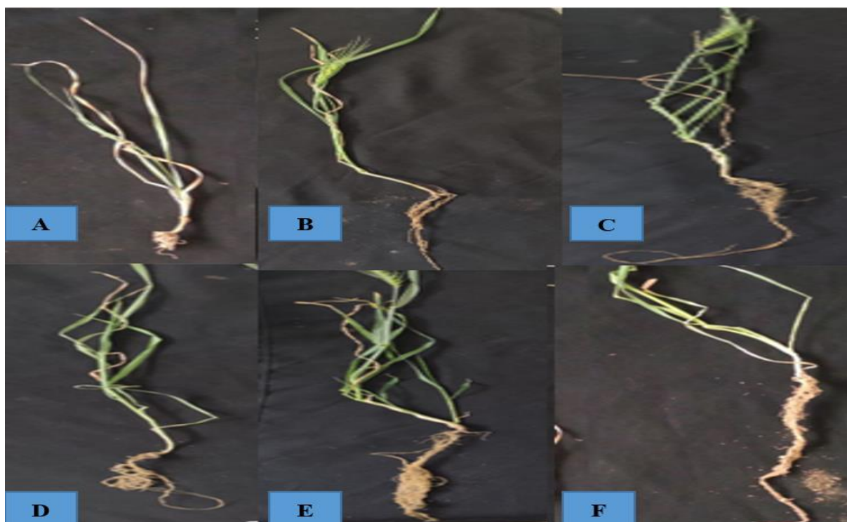
شکل ۲. A، اثبات بیماری‌زایی (شاهد مثبت) قارچ B. Sorokiniana ، B، گیاه سالم (شاهد منفی)، C، تاثیر جدایه UTB 97 در کنترل بیماری، D، تاثیر جدایه UTB 97 + \gamma -PGA در کنترل بیماری، E، تاثیر جدایه UTB 97 بر شاخص‌های رشدی، F، تاثیر جدایه UTB 97 + \gamma -PGA بر شاخص‌های رشدی